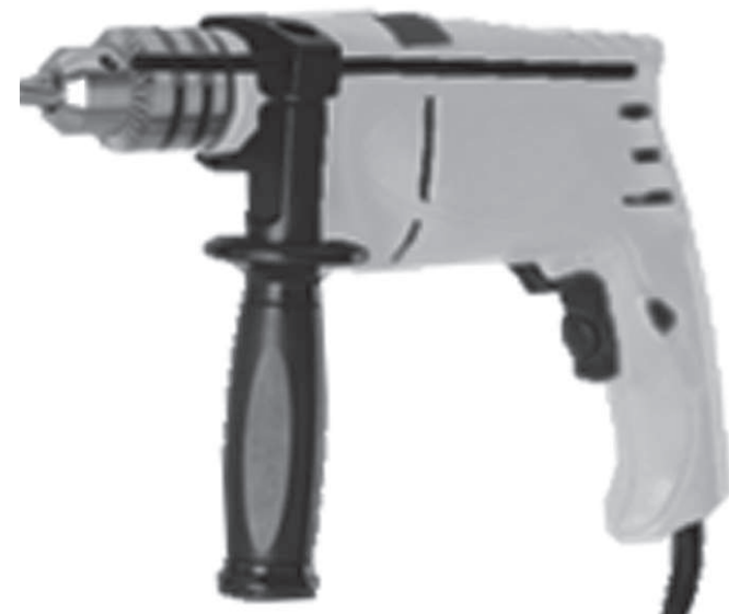
Дрель электрическая ударная

ДЭ - 550 ЕРУМ ДЭ - 650 ЕРУМ ДЭ - 750 ЕРУМ